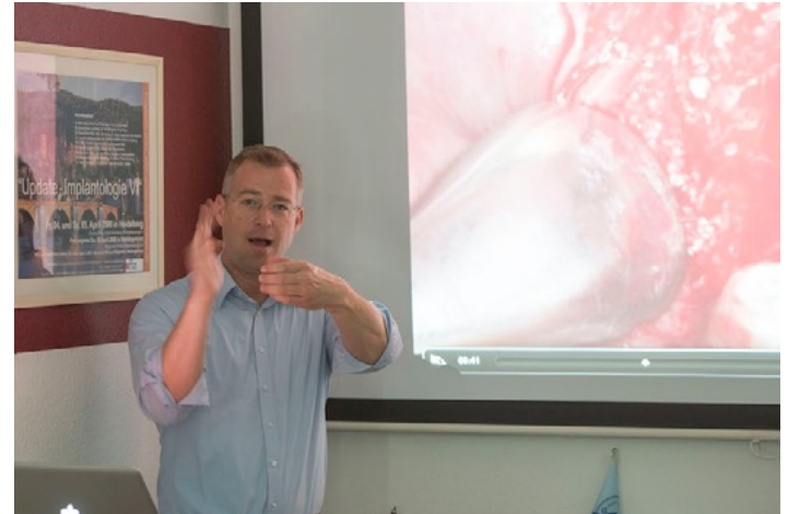
Foto aus dem Kurs 2015

Vor dem Labor stehen Parkplätze zur Verfügung, die Sie gerne nutzen dürfen.