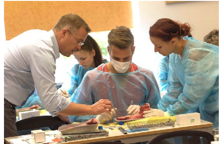
Fotos aus aus dem Kurs 2015

Parkplätze stehen in der Tiefgarage zur Verfügung.